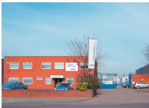
Fertigungsstätte in Hull, England